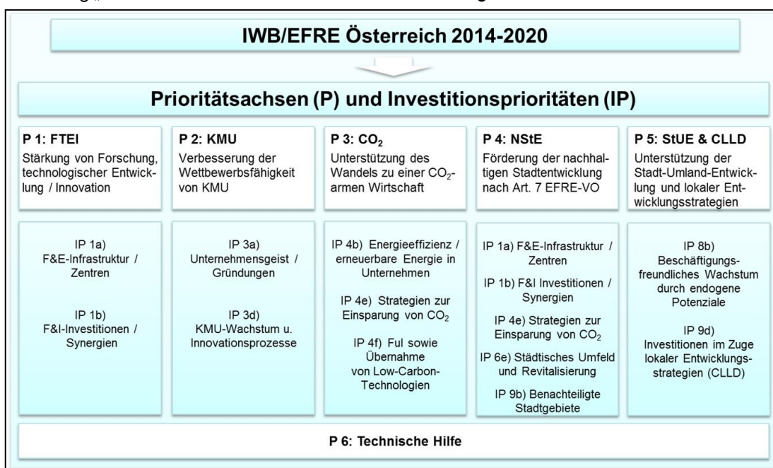
Abbildung „Struktur des österreichischen IWB/EFRE-Programms“: