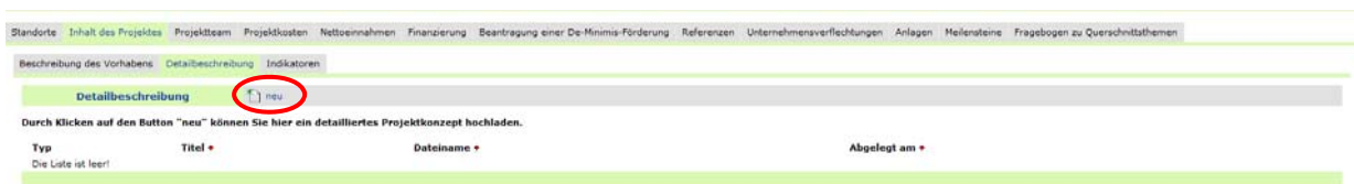
Abbildung 6: IWBecos-Kartenreiter

Die Hauptreiter in der oberen Zeile können untergeordnete Kartenreiter enthalten. Der aktivierte Kartenreiter „Inhalt des Projektes“ gliedert sich zum Beispiel in die Reiter „Beschreibung des Vorhabens“, „Detailbeschreibung“ und „Indikatoren“ (siehe Abbildung). Mit einem Klick auf „neu“ geben Sie Daten in den Kartenreiter erstmalig ein. Die jeweils aktiven Reiter sind farblich hervorgehoben. Wenn bereits Daten vorhanden sind, können Sie diese mit einem Klick auf „bearbeiten“ ändern und/oder erweitern.