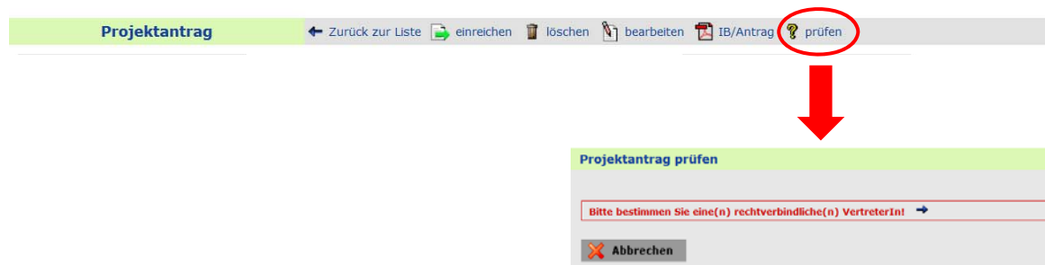
Abbildung 9: IWBecos-Antragsabschluss

Bevor Sie Ihren Projektantrag abschicken bzw. freigeben, haben Sie die Möglichkeit, Ihren Antrag vom System auf Vollständigkeit prüfen zu lassen. IWBecos wird Ihnen anzeigen, welche verpflichtenden Angaben fehlen und von Ihnen noch nachgetragen werden müssen (siehe Beispiel Abbildung). Jeder Eintrag wird mit einem Link zur entsprechenden Erfassungsmaske versehen.