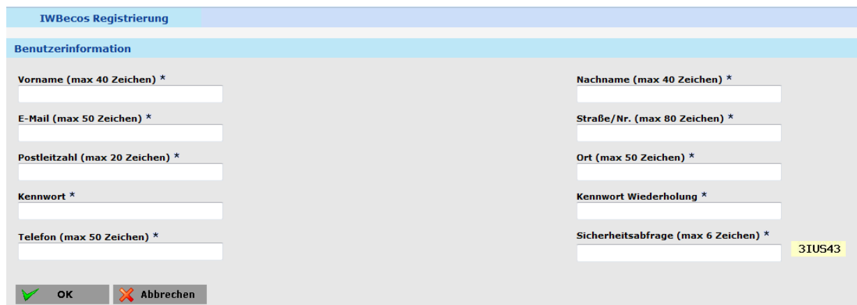
Abbildung 1: Datenerfassungsmaske für die IWBecos Registrierung

Im ersten Schritt werden Sie über die Nutzungsbedingungen für die Verwendung von IWBecos informiert. Mit einem Klick auf „OK“ bestätigen Sie, dass Sie die Nutzungsbedingungen akzeptieren; anschließend werden Sie auf die Erfassungsseite Ihrer Daten weitergeleitet.